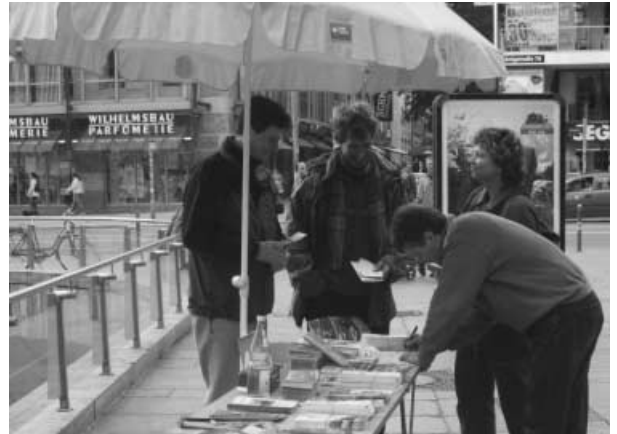
Nach dem Motto „Der Nahverkehr gehört nicht aufs Abstellgleis“ haben wir am 29.04. in der Königsstraße Unterschriften gegen die geplante Kürzung der Regionalisierungsmittel gesammelt.